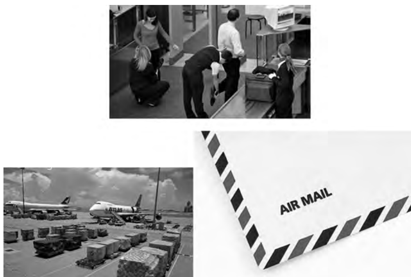
图 1-2 民航安检的对象

民航安检是世界性的航空安全措施,虽然在物品携带的规定上有所不同,但每位乘机旅客都必须接受安全检查是全世界所有的机场统一的一项规定。民航安检的对象是所有乘坐民航班机的旅客及其行李物品、空运货物和邮件(见图 1-2),检查的目标即防止一切可用作劫、炸机的危险品和违禁品进入机场隔离区及航空器。