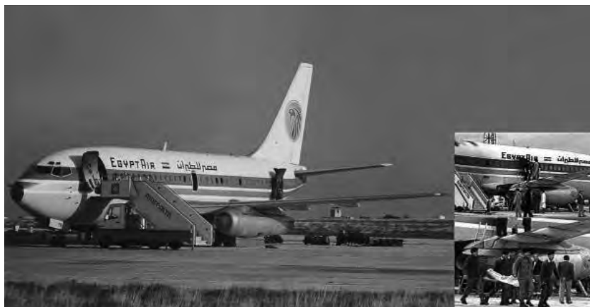
图 1-4 被劫持的飞机

1985年11月23日当地时间20时05分,埃及航空一架波音737客机从希腊雅典机场起飞,目的地为埃及开罗。起飞15分钟后,坐在前排的一名巴勒斯坦青年和其后排的一名埃及青年突然站起来,并掏出枪和手榴弹,说:“不许动!飞机被我们接管了!”他们随即戴上假面具。站在驾驶室旁的第3名恐怖分子冲进驾驶室,用枪命令机长飞往利比亚。机长称燃料不足,劫机者命令机长改飞马耳他。2小时11分钟后,飞机于马耳他卢卡机场降落。飞机停下后,恐怖分子先后将多名人质杀死,并提出加油的要求,但马耳他方面拒绝了这一要求。谈判开始时,劫机者只同意与利比亚方面谈判,利比亚大使在机场指挥塔通过无线电对讲机重复利比亚政府的态度:“由于发生流血事件,利比亚不愿接受这架客机。”谈判结束后,埃及政府决定采取突袭行动,25名突击队员飞往马耳他,美国也派出3名反恐专家予以协助。24日晚8时15分,埃及总统穆巴拉克正式下达突袭命令。整个拯救人质的行动持续了约10分钟。事件最后造成60人死亡,28人受伤,飞机因损毁严重报废,如图1-4所示。