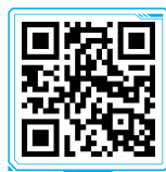
资料 和谐消费环境的 内涵

微观消费环境是指由企业通过各方面工作的有效开展所塑造的消费环境。微观消费环境的主要构成因素包括优质产品和服务的提供、良好企业形象的塑造和各种公众关系的有效处理。微观层次的消费环境是整个消费环境建设的落脚点。