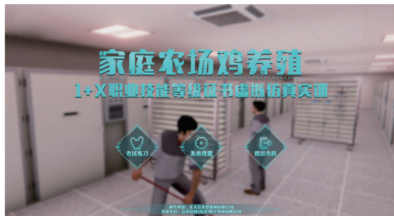
登录虚拟仿真软件操作系统