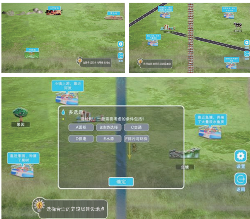
根据要求开始作答