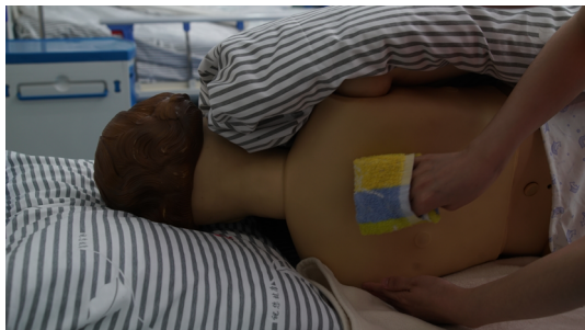
图 1-1-10 擦洗背部