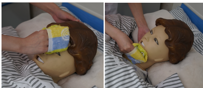
图 1-1-7 擦洗面部、颈部