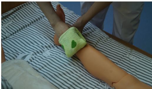
图 1-1-11 擦洗下肢