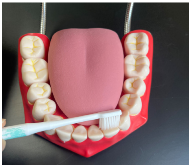
图 1-1-3 内侧面