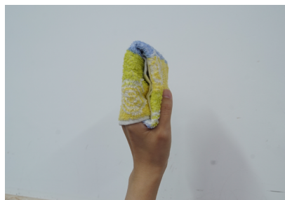
图 1-1-6 折叠毛巾并包于手上