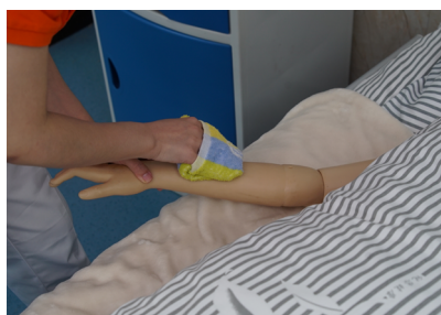
图 1-1-8 擦洗上肢