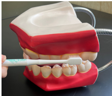
图 1-1-2 外侧面