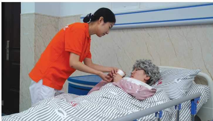
图 1-1-1 漱口