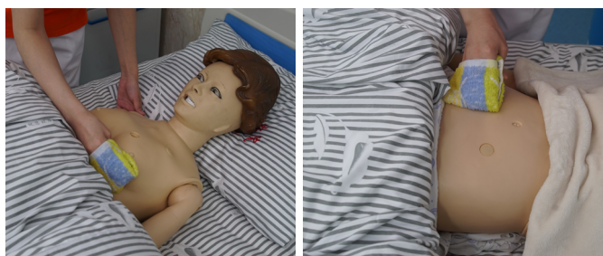
图 1-1-9 擦洗胸腹部