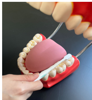
图 1-1-4 咬合面