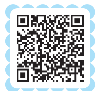
资料：不同颜色交通安全标志表示的含义

游戏是婴幼儿最感兴趣的活动之一，也是最有效的教育方式之一。照护者要充分利用游戏活动，让婴幼儿在轻松、愉快的气氛中接受一些安全知识教育，懂得一些安全技能。例如，照护者在与婴幼儿进行日常互动时可扮演“警察叔叔”，使婴幼儿懂得在走失时要寻求警察叔叔的帮助，或用电话求救。