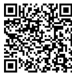
微课 促销方式的 纳税筹划

买一赠一又称既售又送,但赠送视同销售。《国家税务总局关于确认企业所得税收入若干问题的通知》(国税函[2008]875号)规定,企业以买一赠一等方式组合销售本企业商品的,不属于捐赠,应将总的销售金额按各项商品的公允价值的比例来分摊确认各项的销售收入。