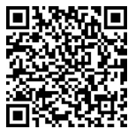
微课 纳税人身份选择的纳税筹划