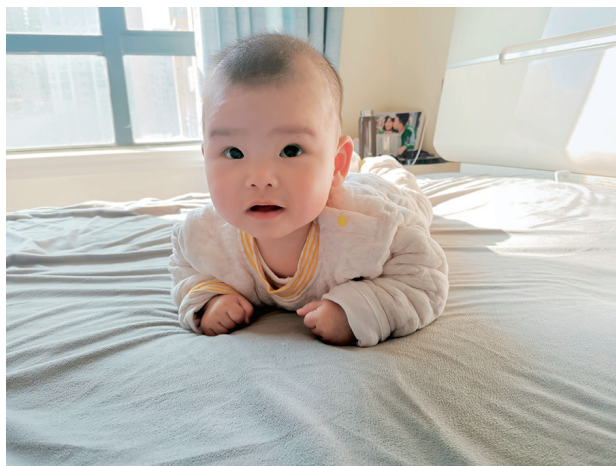
图 1-4 婴儿大肌肉动作开始发展