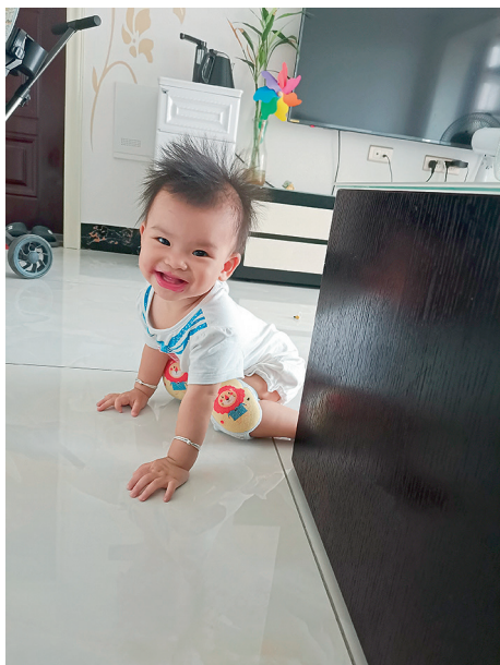
图 1-9 婴儿的亲社会行为——对他人微笑

儿与成人语言交际的开始。婴儿在这一时期经常发出咿咿呀呀的声音，有声调上的变化，听起来像在说话，可却没有明确的意义。