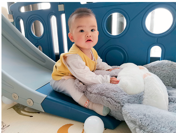
图 1-5 婴儿独坐