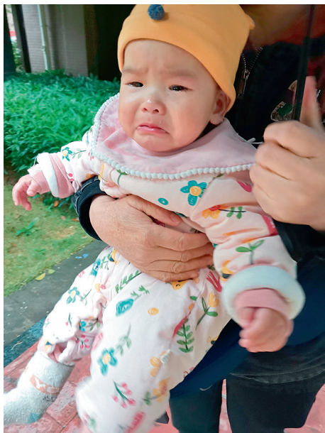
图 1-6 婴儿出现分离焦虑

狭义的亲子关系即依恋,指儿童早期与父母的情感关系。父母是婴儿最亲近、与婴儿接触最多的人,良好的亲子关系对婴儿的社会性