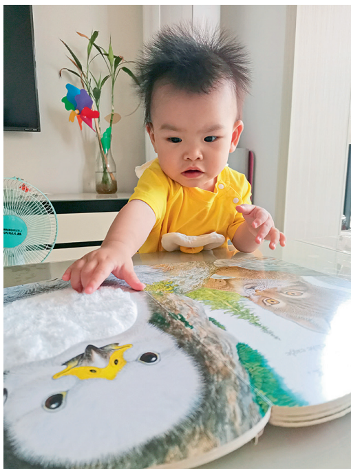
图 1-8 婴儿再认熟悉的事物

1岁以前婴儿的记忆能力较差，但记忆时长逐渐延长，记忆的内容逐渐增多，在反复出现的情况下，婴儿能够逐渐认识周围熟悉的事物并保持对该事物的记忆。在12个月左右能再认相隔几天或十几天的人与物，记忆保持的时间越来越长，但主要是无意识记。（图1-8）