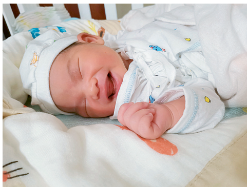
图1-1 新生儿手握拳状态