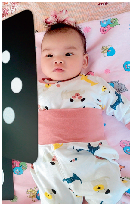
图 1-2 婴儿头眼协调开始发展