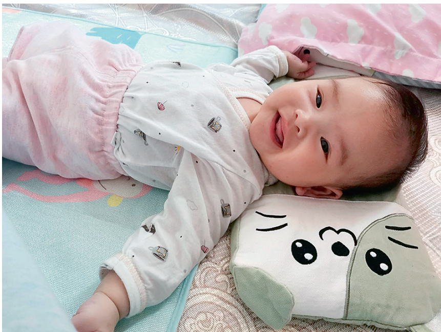
图1-3 婴儿人际交往需求的表达