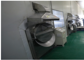
图 1-16 转筒式炒药机