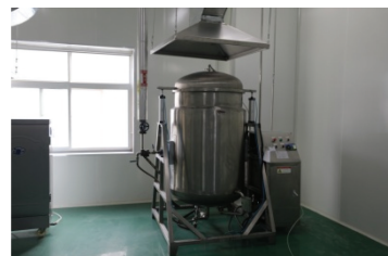
图 1-15 全自动蒸煮机