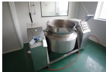
图 1-14 可倾式蒸煮锅