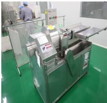
图 1-10 转盘式切药机