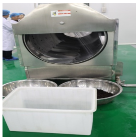
图 1-2 滚筒式清洗机