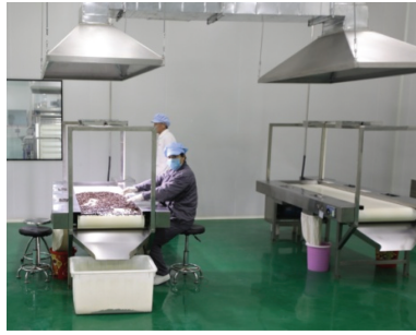
图 1-5 不锈钢挑选台