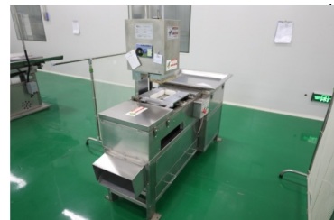
图 1-12 平式刨片机