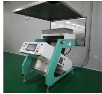
图 1-6 色选机