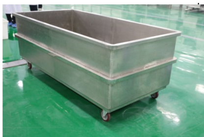
图 1-1 不锈钢洗药池