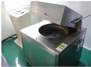
图 1-17 中低温煨药锅