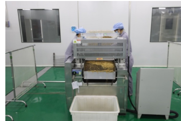
图 1-9 直线往复式切药机