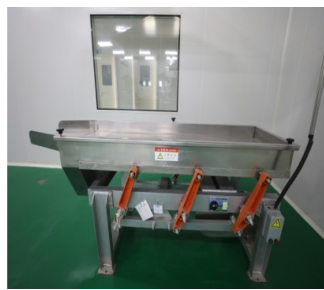
图 1-3 药用漩涡式振动筛