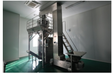
图 1-18 包装机