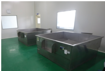
图 1-13 热风循环烘干箱