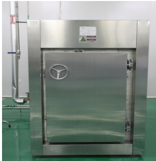
图 1-7 真空相置换式润药机