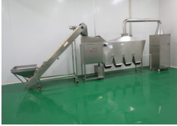
图 1-4 风选、筛选、机械化挑选机组