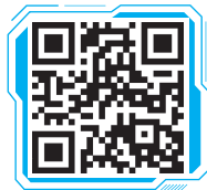
视频 语气词“啊”的变读