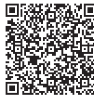
地表水采样原始数据 记录填写(视频)