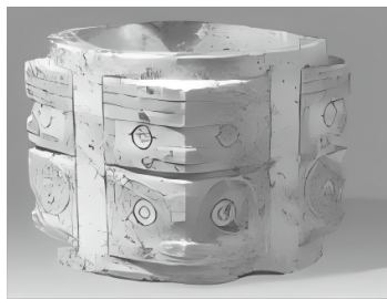
图 1-6 良渚文化的代表——神人纹玉琮王