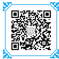
视频：中华优秀传统文化教育的教学目标

中华优秀传统文化是先人留给我们的宝贵历史遗产和伟大精神宝库，学习和掌握其中的思想精华，有助于我们树立正确的世界观、人生观和价值观，对我们的生存方式与生活态度及社会进步有着深远的影响和重要的现实意义。