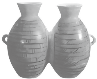
图 1-5 仰韶文化的代表——彩陶双连壶