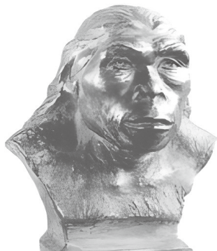
图 1-3 “蓝田猿人”复原头像

原始文化是指人类发明并使用文字以前的历史文化。人类的发展大体上可以分为猿人、古人和新人三个阶段，据考古学家研究，人类发展的三个阶段在中国都有迹可循。距今约 170 万年前，中华民族的祖先就生活在我们足下的土地上，他们的足迹遍及全国各地，并开始创造古老的中华文明。1998 年，考古人员在安徽繁昌县（今芜湖繁昌区）孙村镇发现了距今约 240 万年至 200 万年的人类遗址，这是中国境内发现的最早的人类活动遗址。1965 年，考古人员在云南元谋县上那蚌村发现了距今约 170 万年的猿人化石，证明了元谋人的存在。1963 年，考古学家在陕西蓝田县发现了距今约 80 万年至 75 万年的“蓝田猿人”化石（“蓝田猿人”复原头像见图 1-3）。1929 年，考古人员在北京周口店龙骨山发现了距今约 70 万年至 20 万年的“北京猿人”遗址。这一阶段，猿人已经开始使用经简单加工的石块工具，掌握了摩擦生火技术，原始人这些有意识的活动被视作人类文化的起源。