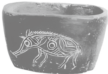
图 1-4 河姆渡文化的代表——黑陶

约 10 万年前，氏族公社开始形成，分为母系氏族公社和父系氏族公社。考古发现的比较有代表性的母系氏族公社古文化遗址有山顶洞人遗址、河姆渡遗址、半坡遗址、仰韶遗址等；著名的父系氏族公社古文化遗址有大汶口遗址、龙山遗址、良渚遗址等。距今 1.8 万多年的山顶洞人已经能磨制骨针和骨、石饰物，在距今约 7000 多年的河姆渡文化时期，中华先民已进入新石器时代，其生产、生活用具已是精致的石器、骨器及手制的陶器（河姆渡文化的代表——黑陶，见图 1-4），农业已有了相当程度的发展。在公元前 5000 年至公元前 3000 年的仰韶文化时期，中华先民已经过上了定居的农业生活，开始饲养家畜，制造的陶器已有了颜色和花纹（仰韶文化的代表——彩陶双连壶，见图 1-5）。在距今 5000 年至 4000 年的良渚文化时期，稻作农业、竹木制