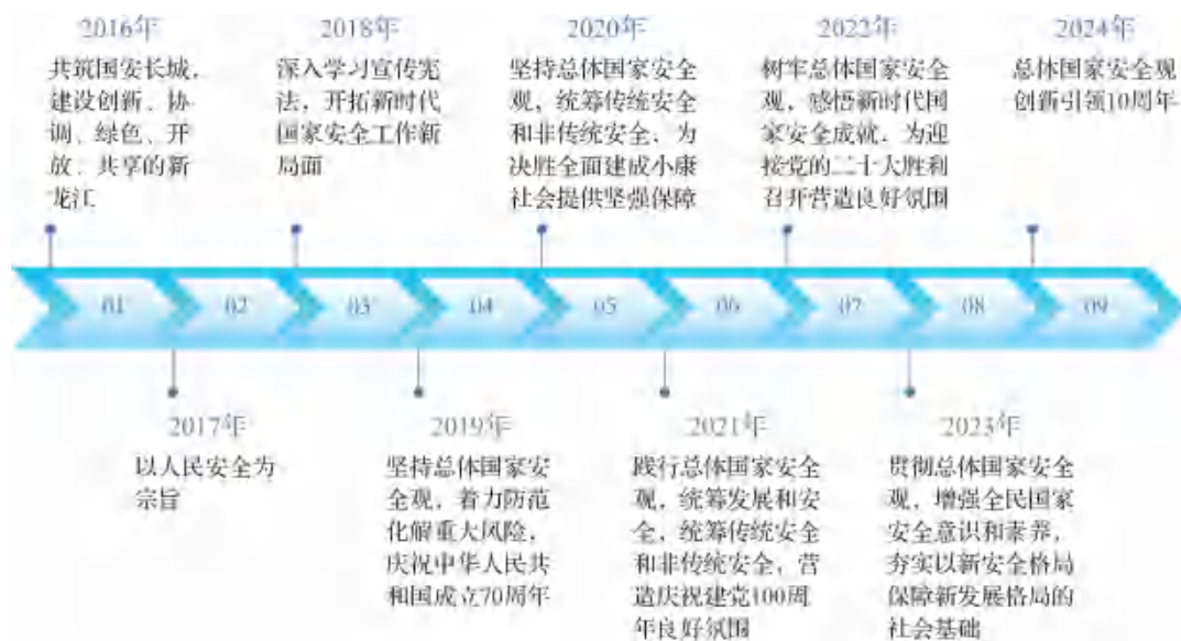
图 1-1 历年国家安全教育日主题