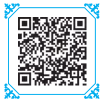
音频 《水龙吟·登建康赏心亭》